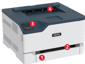
Imprimante couleur C230 de Xerox®