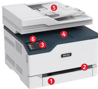
Imprimante couleur multifonction C235 de Xerox®