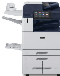
Imprimante couleur multifonction AltaLink® C8130/ C8135/C8145/ C8155/C8170 de Xerox®