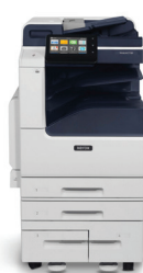
Imprimante couleur multifonction VersaLink® C7120/C7125/ C7130 de Xerox®