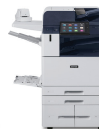
Imprimante multifonction AltaLink® B8145/ B8155/B8170 de Xerox®

* Produit non disponible dans toutes les régions, veuillez consulter votre représentant commercial.