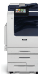
Imprimante multifonction VersaLink® B7125/ B7130/B7135 de Xerox®