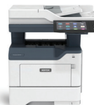
Imprimante multifonctions VersaLink® B415 de Xerox®