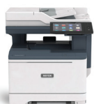
Imprimante couleur multifonctions VersaLink® C415 de Xerox®